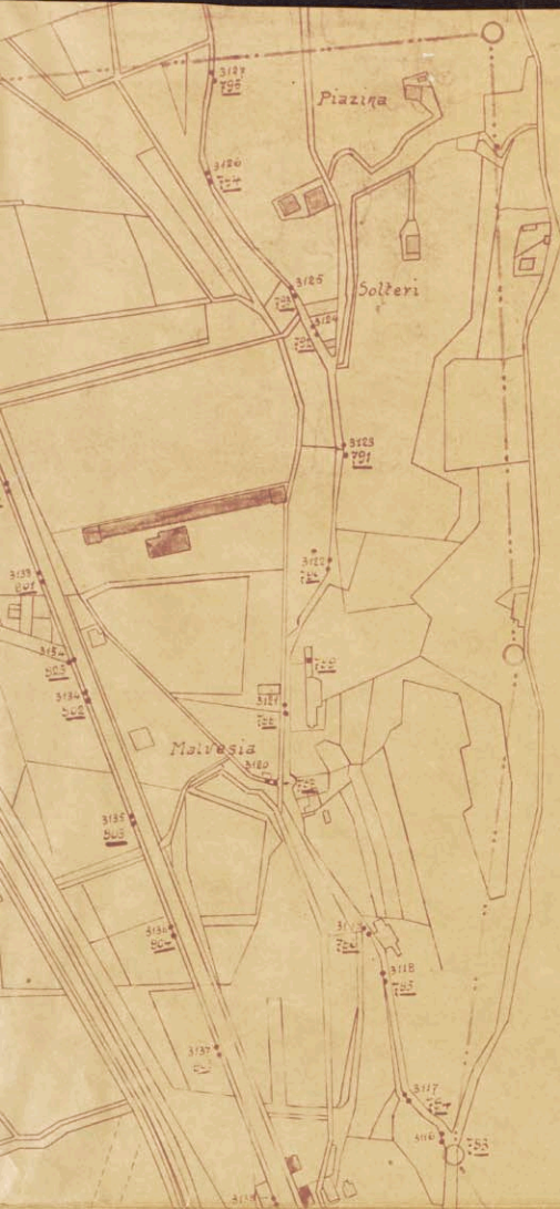
TAVOLA I ---